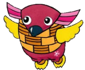
さいたま桜のマスコット サクロウくん

以上が基本的な実習の流れですが、事業主様のご都合、ご要望に添って実施させていただきます。